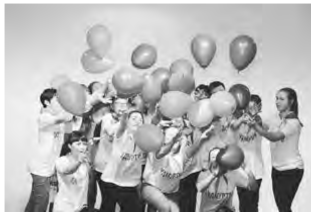
Ребята из РДОО «Родники»