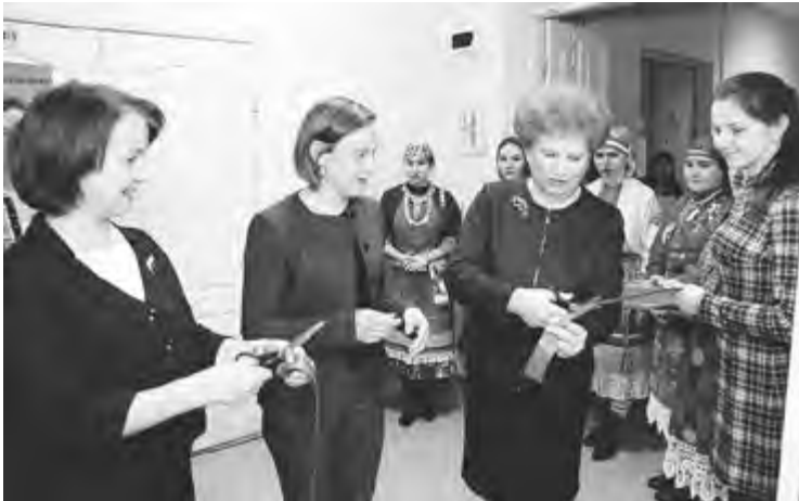
Центр открывали под песню ансамбля «Чипчирган» и перерезая ленточку

Трудно переоценить возможности Центра для организации планомерной научно-исследовательской, инновационной и образовательной деятельности, касающейся финского языка и культуры. При всей важности этой работы, в которой заинтересована вся система образования Удмуртии – от школ до профильного министерства, науч-