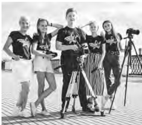
Успешная команда «Первого городского школьного телевидения»

Я нисколько не жалею, что училась в УдГУ. Да, наверно, техническая база у нас была слабее, чем в столичных вузах, но мы как-то этого не чувствовали. Главное – было интересно учиться, и химию я любила и до сих пор люблю трепетно. Были достойные преподаватели: не помню ни одного, кто бы просто начитывал часы. Они все очень любили своё дело и увлекали им студентов. Это бы-