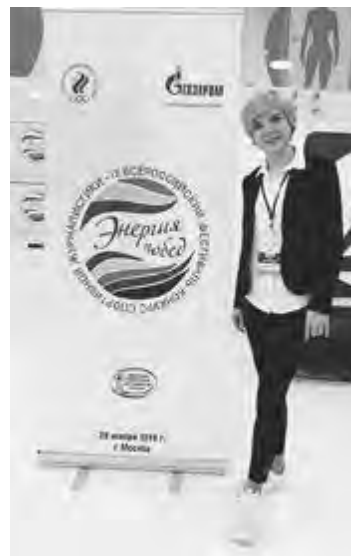
На награждении победителей конкурса спортивной журналистики Олимпийского комитета России «Энергия побед»