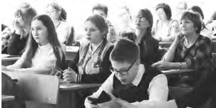
Олимпиада по краеведению всегда становится событием для школьников и педагогов Удмуртии.

школьники выполняли творческую письменную работу на тему «Как сохраняется память о Великой Отечественной войне в моей деревне (селе, городе, посёлке)», старшеклассники писали творческую работу на тему «Экскурсия по моей деревне (селу, посёлку, городу)», в которой важно было представить свой населённый пункт по любому, избранному учеником аспекту: археологическому, этнографическому, историческому, географическому. Важно, чтобы ученик описал наиболее значимые для него черты своей малой Родины. Все задания олимпиады ученики могли выполнять на русском или удмуртском языке. Отраднo, что каждый год ребята пользуются этой возможностью, демонстрируя также и знание родного языка.