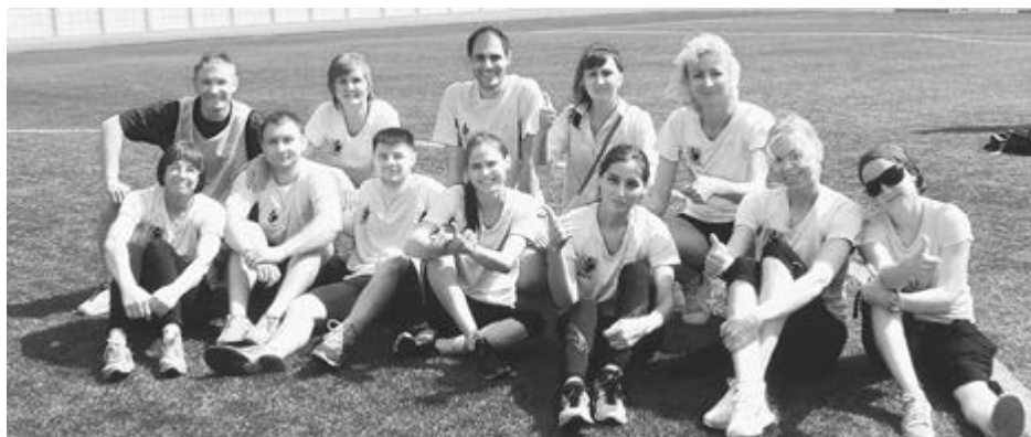
Эти весёлые люди победили в «Весёлых стартах»