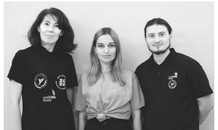
Серебро за рекламу