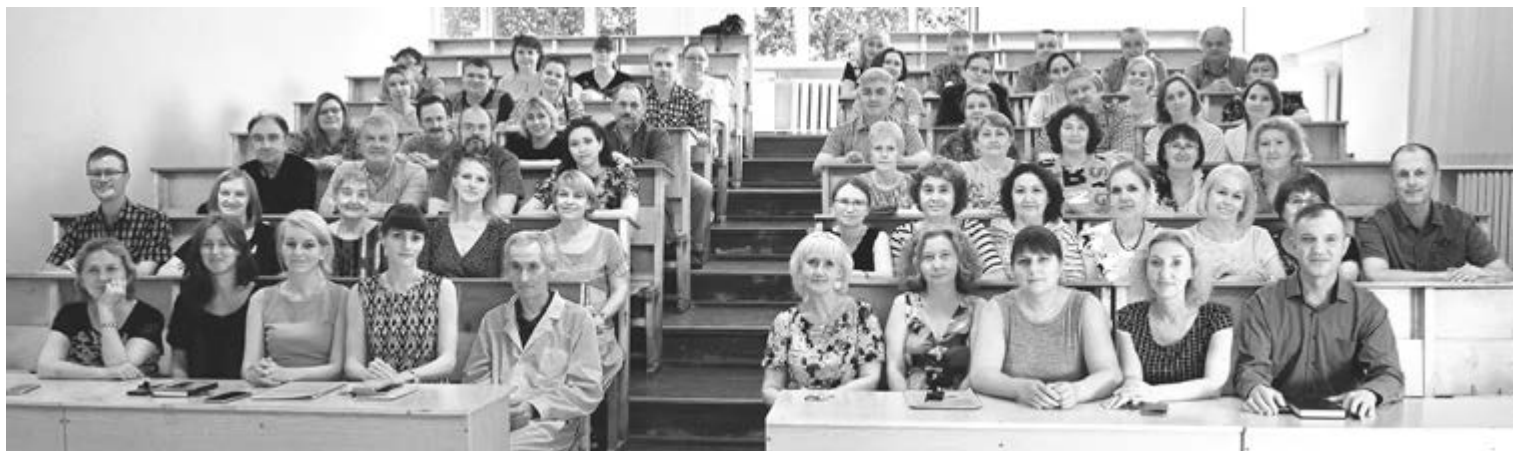
Коллектив Института естественных наук и его новый директор (справа в первом ряду)

– Сильная сторона нашего института – высокопрофессиональные заведующие кафедрами. И