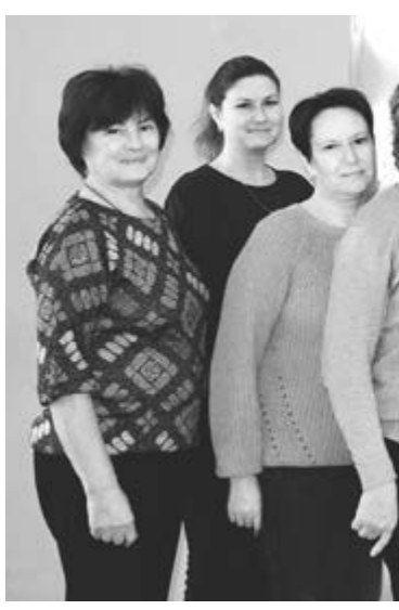
В централизованной бухгалтерии университета – 5 отделов, 30 квалифицированных специалистов. Эту большую команду представляют самые улыбочивые сотрудники.

боту раньше всех, а уходят позже всех. Что ж... такова специфика профессии. И дело даже не в том, что они не умеют построить свою работу так, чтобы всё успевать вовремя. Просто так уж получается, что ошибки, допущенные на различных этапах документооборота, выливаются в проблемы при формировании финансовой отчётности университета. И возникшие проблемы приходится решать бухгалтеру весьма оперативно, так как сроки отчётности строго регламентированы.