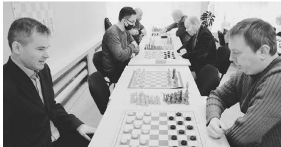
Шашкам все возрасты покорны

Очень важным мне кажется назвать лучших спортсменов, которые защищают честь УдГУ на всех уровнях, поимённо.