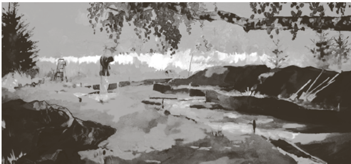
Работа на раскопе. Гуашь, бумага