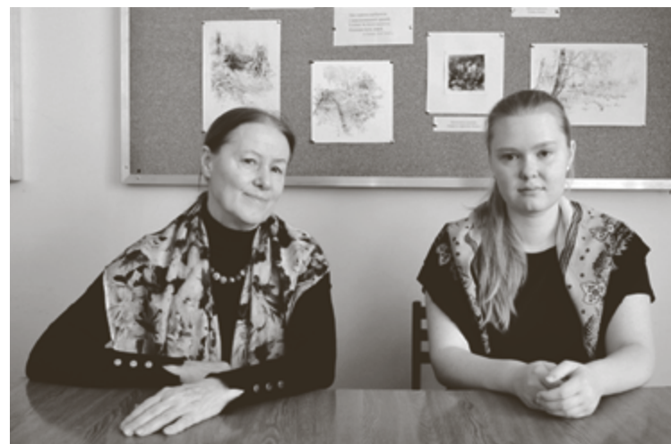
Преподаватель и студент могут в своём единодушии придумать интересные проекты

У древнего населения, оставившего Кудашевский I некрополь, существовали разные традиции положения умерших в могиле: женщины захоронены головой к реке, а мужчины, наоборот, головой от реки. Умершие уложены по обряду ингумации, также фиксируется кремация. Прослеживается тенденция – чем бо-