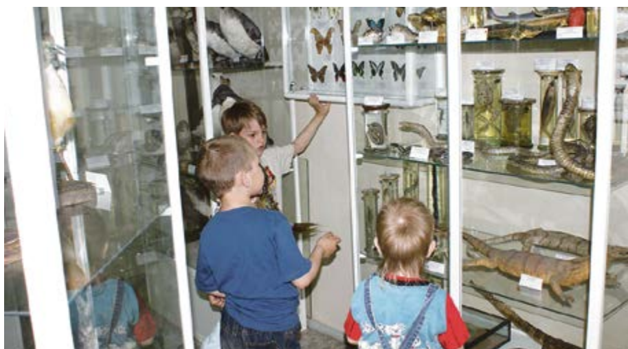
Кабинет зоологии и палеонтологии всегда очень нравится детям

Геологический музей открылся на географическом факультете в 1964 г. с появлением учебных коллекций минералов. Специалисты отмечают его большую практическую роль в подготовке учителей-географов в Удмуртии. Занятия и работа в музее современных студентов не прекращается. В Геологическом музее содержатся ископаемые останки беспозвоночных – самая богатая коллекция среди государственных музеев Удмуртии.