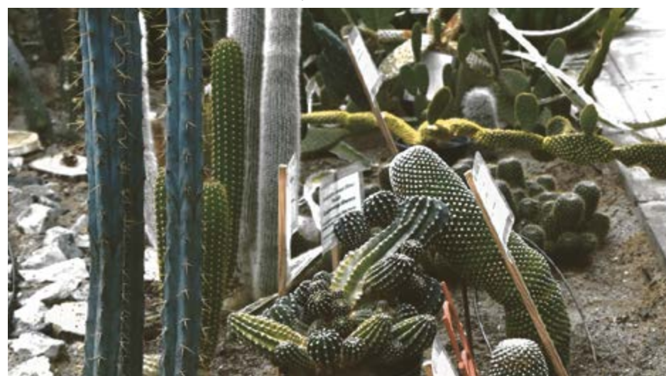
Эта коллекция живых растений принадлежит, конечно, не Гербарию, а Ботаническому саду УдГУ (см. на стр. 9)

В кабинете – в шкафах и штабелях коробок – хранится фондовый гербарий для научной работы специалистов и студентов. Его пока невозможно демонстри-