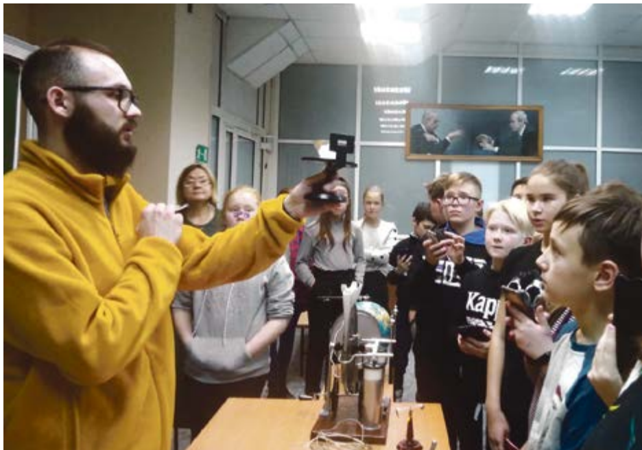
Интерес к науке начинается с опытов