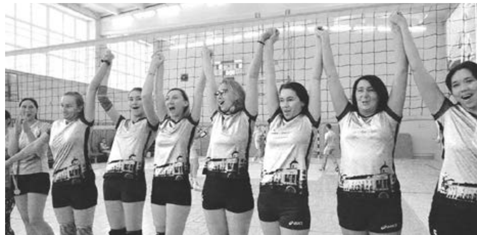
Сборная УдГУ по волейболу на высоте – как всегда

– Спортсменов каждого института и подразделения надо поощрять. Понятно, что они любят спорт и хотят участвовать в состязаниях, но и энтузиазм надо поддерживать. Хорошо бы добавлять за спорт баллы в личном рейтинге преподавателя, выплачивать достойные премии. Небольшие премии были всегда, а в прошлом году их увеличили: за 1 место в республикан-