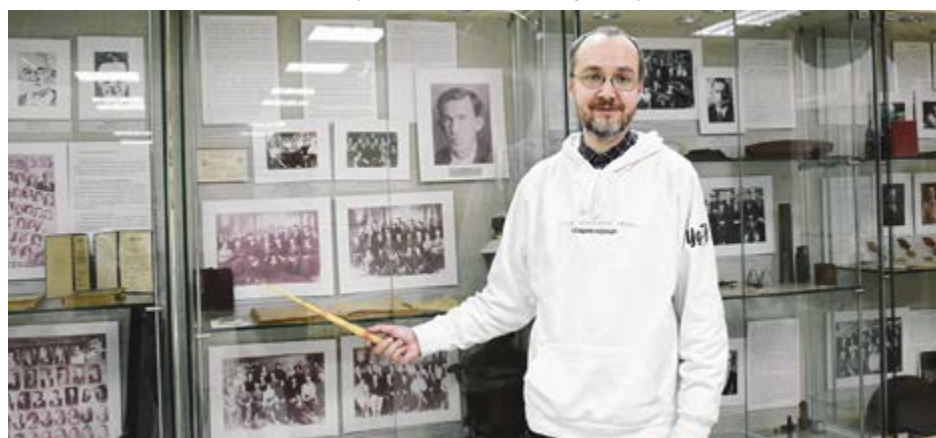
Экскурсия по истории УдГУ начинается со стенда 1930-х годов, когда встал вопрос: выживет ли задуманный вуз?

Здесь находится Музей истории УГПИ-УдГУ , но это название народное, а