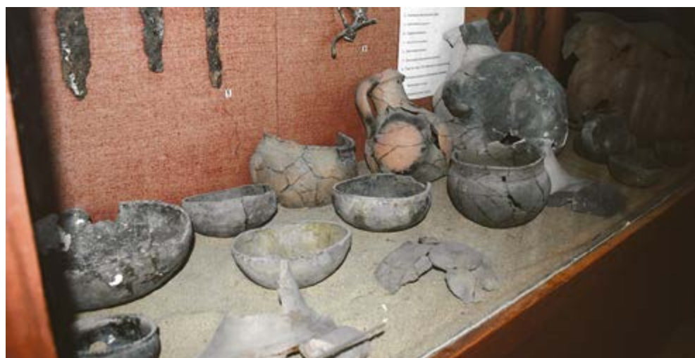
Экспонаты археологической коллекции ИИИС