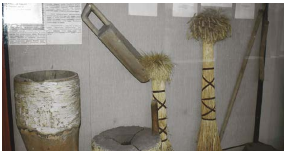
Предметы быта прошлых веков показывает этнографический музей

Экскурсовод Юлия Ардашева