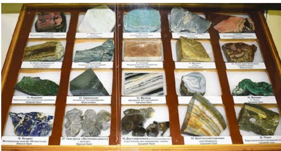
Коллекция минералов, которой гордится ИНиГ