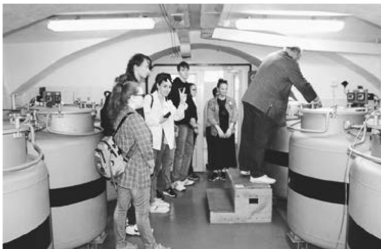
Посещение лаборатории криологии

РАН, геологический музей и институт экологии растений и животных. Следующим стал Каменск-Уральский. Этот небольшой город – уникальное место. Казалось бы, заходишь в обычный городской парк (немного похожий на ижевский Парк Кирова), только оказываешься... в горах. Река Каменка пробивает себе путь возле отвесных скал, в овражках выходят руды металлов и полудрагоценные камни. Открытые склоны покрывает настоящая степная растительность, характерная не для среднего, а, скорее, для южного Урала.