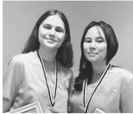
Им вручен медальон