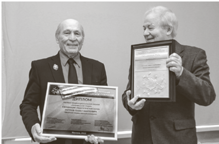
Вручение награды на Учёном совете УдГУ

– Для участия в конкурсе готовится соответствующее представление согласно требованиям РПС, где должны быть указаны конкретные достижения соискателя, такие как учёная степень и звание, количество подготовленных учеников (кандидатов наук, докторов наук), не менее трёх учебников и монографий, индекс Хирша по РИНЦ – количественная характеристика продуктивности учёного, цитируемость его работ и другие показатели. Вердикт выносится конкурсной комиссией по присуждению данной премии. Председателем комиссии в этом году был