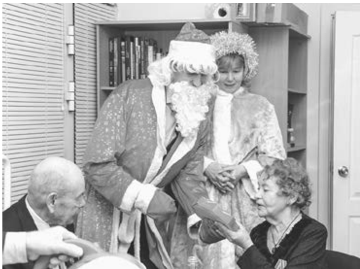
Дед Мороз и Снегурочка от профкома УдГУ поздравляют ветеранов вуза

Важнейшим элементом деятельности профсоюза, пожалуй, даже более значимым, чем защита прав, является непосредственное участие в управлении организацией, а, значит, создание и правовое закрепление дополнительных прав и гарантий работников, трансформация интересов работников в их новые права. Этим занимается профсоюз на всех уровнях социального партнёрства – от федерального до локального, до конкретной организации. Ряд гарантий закреплён в новом Коллективном договоре университета, во множестве локальных нормативных актов. Мы понимаем эти достижения как результат совместной работы с работодателем, направ-