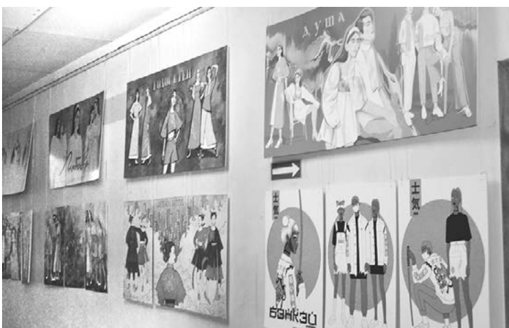
Стильный коридор к буфету 6 корпуса

– В других корпусах я редко бываю, только в первый корпус обычно прихожу по административным делам, поэтому он воспринимается как центр деловых отношений, принятия решений. Но в прошлом семестре здесь