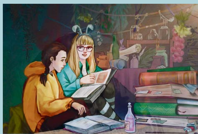
«В гостях у белого кролика», диджитал-арт

Каролина, мой оригинальный персонаж, не стала исключением».