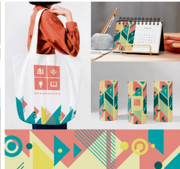
Проекты для Малопургинского района