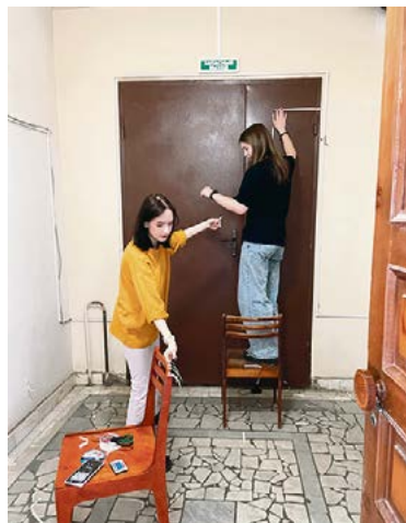
Процесс организации выставки

ных ритуалах, которые мы привыкли выполнять автоматически. Студенты предлагают поместить рутину нашей жизни в чистое пространство музея, чтобы актуализировать то, что считается неважным, неинтересным и лишённым смысла, вернуть осознанность повседневности и сравнить её с фантазией.