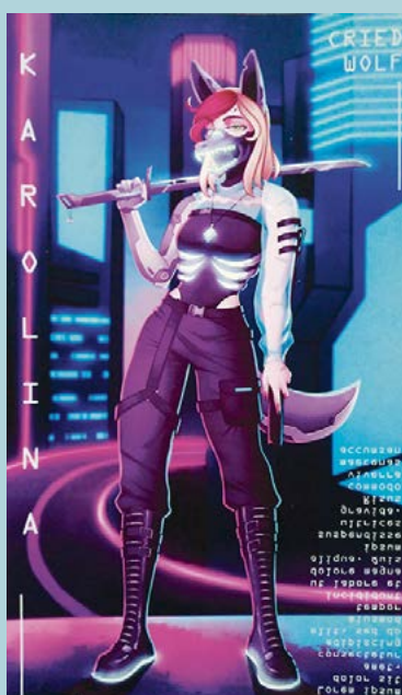
«Это Каролина», диджитал-арт

Вся прелесть работы заключается в мелких деталях, за счёт чего она выглядит полноценно даже без цвета».