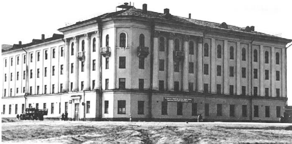
4 корпус XX век

Впоследствии Г-образное здание достраивалось до П-образного, котлованом будущего крыла 4-го корпуса занимались историки-археологи. По их рассказам, при раскопках там находили человеческие останки. Скорее всего, это было связано с тем, что рядом находилось Тро-