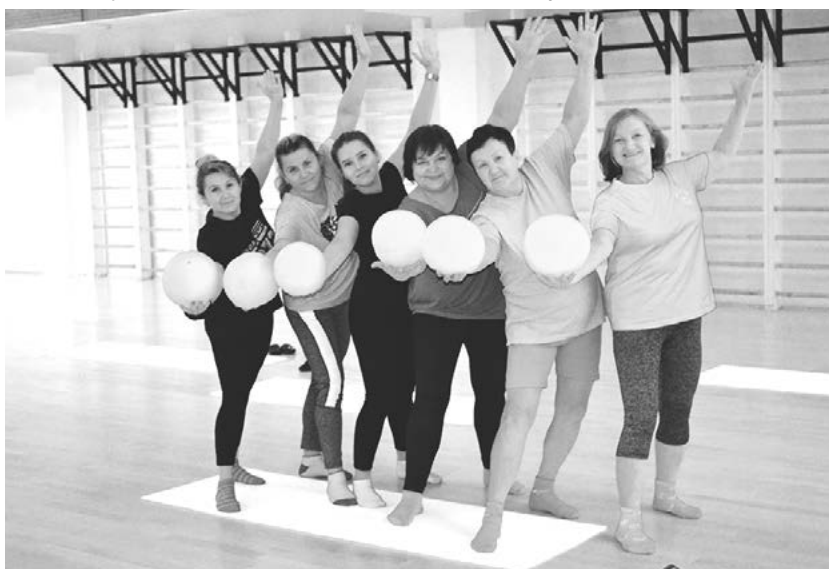
Группа фитнес-дам, их тренер четвёртая слева

том, что всего 3 упражнения или 15 минут в день будет достаточно для того, чтобы вы похудели или что-то у вас исправилось – это неправда, всё-таки должна быть достаточная продолжительность занятий, хотя бы от 30 до 50 минут и более. И нам нужно за 55 минут успеть многое: расправить спины, улыбнуться, подышать и, конечно, привести всё в тонус. За одно занятие всё сразу подтянуть, естественно, не получится. Сначала нужно понять, какие мышцы работают и что лучше делать, толь-