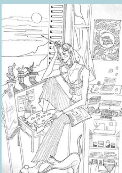
«Синергия творчества», линеры

Ульяна Телицина, 3 курс: «Вспомните свои трубы в ванной. Да, просто трубы. Вот эти – обшарпанные, разноцветные и грязные или же новые, чистенькие и свежескрашенные. В какой-то момент я обратила внимание на этот кусочек ванной, и теперь с каждым днём они мне кажутся всё красивее и живописнее, всё более достойными отдельного сюжета. Руки потянулись к свежей упаковке темперы, и именно с этой работы началась серия жизненных зарисовок».