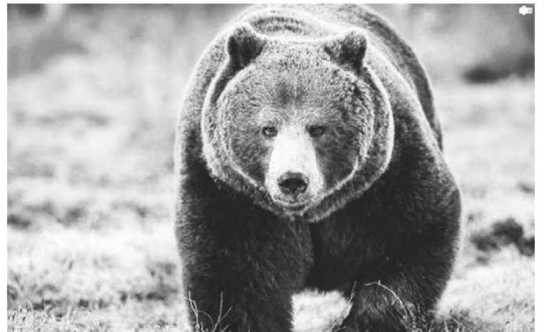
Сибирский бурый медведь

Наиболее мелкие формы бурого медведя встречаются в более южных частях ареала этого вида в Азии. Наши медведи адаптированы к более скудным источникам пищи. На обширных территориях российского ареала преобладает вегетарианский тип питания медведя, нередко он пополняет свой рацион падалью, и ещё в его меню принято выделять нажировочные корма (кедровые орехи, фрукты, ягоды), и вот здесь обнаруживается пищевая конкуренция бурого медведя, в том числе, и человеку. Это всё – сложная цепочка отношений в биосистеме. Но