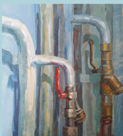
«Жизнь 1», картон, масло

Художественного музейно-образовательного центра ИИИД