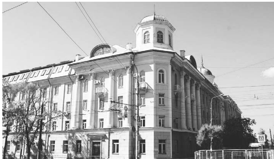
4 корпус XXI век

ме»: «Г-образное здание 4 корпуса УдГУ (на углу улиц Удмуртской и Красногеройской) ввели в эксплуатацию в 1956 году. Изначально это была школа-интернат для детей, оставшихся без родителей и детей из многодетных семей. Нас у мамы было семеро, поэтому меня и двух моих сестёр взяли в эту школу. Такие как я были на 5-ти дневке, на выходные нас забирала домой, а у кого не было родителей, жили в интернате постоянно.