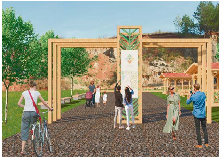
Проект «Экотропа в Алнашском районе»