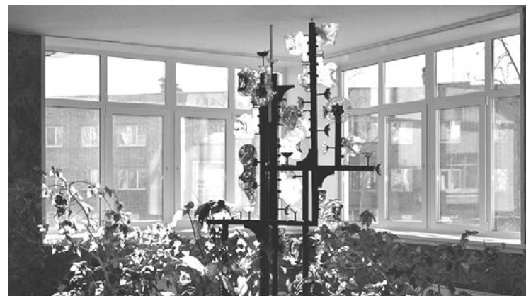
Здесь встречают свет и цвет

– Мне кажется, что порой не хватает знаний правил этикета, связанных с культурой устной речи, поведением в стенах университета, на занятиях. Я наблюдаю и вижу, что иногда некоторые студенты позволяют себе громко разговаривать в коридоре или