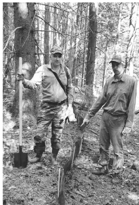
Сотрудники лаборатории в полевых условиях

Несколько лет назад у нас была работа по Камбарке – Агентство природоохранных технологий заказало исследование биоты и оценку воздействия на неё, в связи со строительством ПТК «Камбарка». Сейчас, в 2023 году, эта работа получила продолжение. По объектам уничтожения химического оружия (ОУХО) в Камбарке, в Кизнере и в Курганской области тоже были изыска-