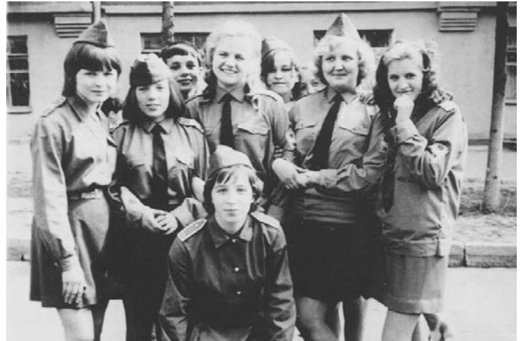
Девушки в военной форме – советский тренд Первомайской демонстрации

Часто участвовали в соревнованиях по лёгкой атлетике. Победителей награждали поездками по городам-героям СССР. Мы ездили в Ульяновск, на экскурсию по ленинским местам. Лучшим ученикам повезло съездить с военруком в Брест. Вспоминается история нашего посещения Мавзолея в Москве. Очередь была огромная, люди стояли по не-