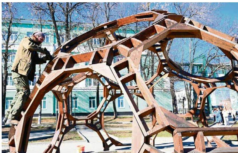
Процесс создания купола, так удивляющего теперь прохожих

Мне, например, всегда было интересно заниматься решением очень сложных задач. Всё началось ещё в вузе. Как-то преподаватель дал задание: «У вас есть какой-то модуль, например, бревно. Оно определённого размера. Нужно создать максимум пространства для жизни, используя минимальное ко-