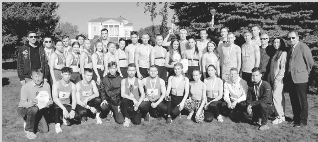
Большая победная сборная УдГУ

УдГУ не остался без медалей и по итогам забега команд среди вузов. Наша первая команда выиграла Эстафету с 45-секундным отрывом, подтвердив прошлогоднее звание чемпионов, а вторая команда заняла третье место, замкнув тройку призёров!