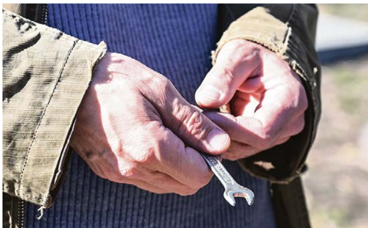
Основной инструмент при сборке конструкции

(конструкция должна быть очень лёгкой) и способ соединения конструктивных элементов, образующих треугольник. Суть его теории в том, что из треугольников можно собрать любую форму, она не развалится. На мой взгляд, он пренебрег самой морфологией связей.