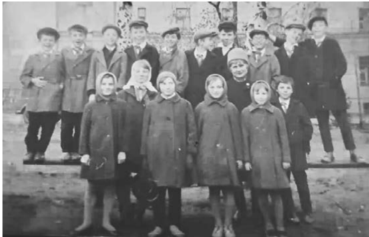
Всем классом на фоне школы-интерната

С удовольствием, по очереди дежурили в столовой, накрывали