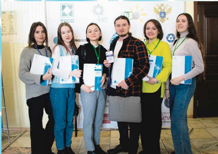
Ярпиар для студентов ИСК – это впечатления и победы

– Мы принимали участие в решении кейсов от крупных компаний Viola, Lindstr m SPN, Kitfort и библиотеки имени Н.В. Гоголя, писали статьи для научно-практической конференции, ходили на мастер-классы, ездили на экскурсию на завод «Балтика», участвовали в квесте и тимбилдинге. Всё это принесло нам массу различных эмоций. Мы побывали в интересных местах, познакомились с новыми людьми, почерпнули для себя много нужных методик для работы. Кроме того, получили удовольствие от прогулок по солнечному апрельскому Санкт-Петербургу.